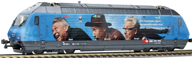
28 237 : SBB Re 460, «Ihre Freizeit Tester», Lok Nr. 460076-3