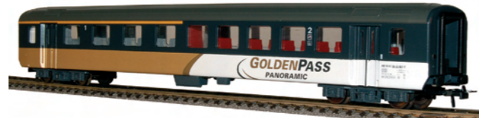
52 022 ~ AC, 52 023 = DC BLS EW 1, AB, 1./2. Klasse, Golden Pass Line