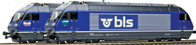
28 519 : BLS Re 465, Lötschental, Lok Nr. 465006-5 28 532 : BLS Re 465, Napf, Lok Nr. 465009-9