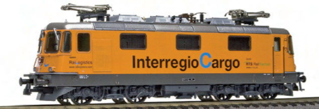
16 219 : Interregio Cargo, Re 4/4 II , «RTS Rail Traction», Lok Nr. 11320, Lampen rechteckig