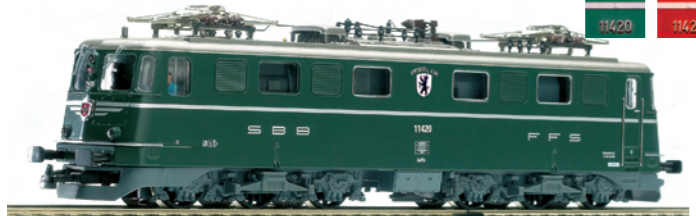
11 044 : Ae 6/6 Kantonslok grün, Appenzel A.Rh., Lok Nr. 11420 11 045 : Ae 6/6 Kantonslok rot, Appenzel A.Rh., Lok Nr. 11420