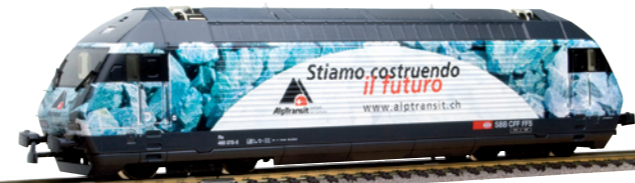
28 228 : SBB Re 460, Alptransit II «Wir bauen die Zukunft», Lok Nr. 460075-5