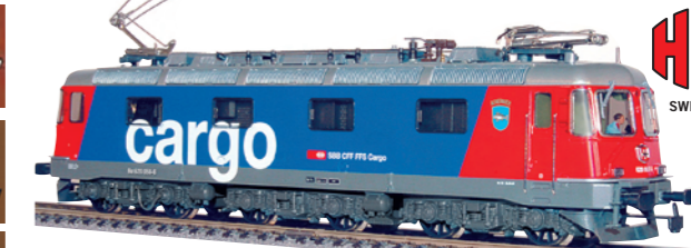
20 054 : SBB Re 6/6 Cargo, Auvernier, Lok Nr. 620058-8, 2 Motoren