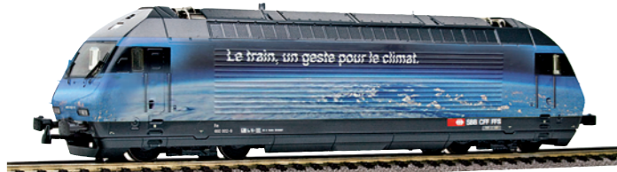
28 236 : SBB Re 460, «Fürs Klima die Bahn», Lok Nr. 460002-9