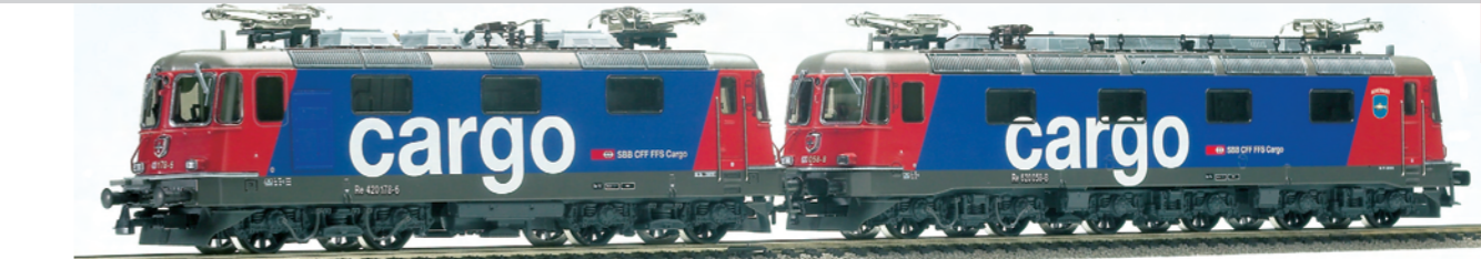
36 023 : SBB Re 10/10 Cargo Re 420 Cargo, Lok Nr. 420178-6 Re 620 Cargo, Auvernier, Lok Nr. 620058-8