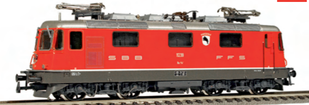
16 206 : SBB Re 4/4 II rot, Porrentruy, Lok Nr. 11239 Rechteckige Lampen mit Klimaanlage und IC 16 211 : SBB Re 4/4 II rot, Lok Nr. 11257 mit Klimaanlage