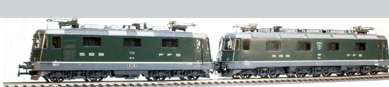
36 022 : SBB Re 10/10, grün Re 4/4 II , grün, Lok Nr. 11344, mit Klimaanlage und Re 6/6, grün, Heerbrugg, Lok Nr. 11617