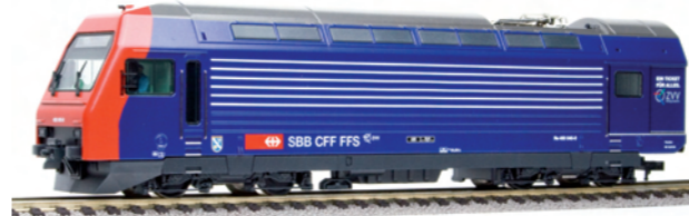
30 023 : SBB Re 450 der S-Bahn Zürich, Feldbach, Lok Nr. 450 045-0, blaue Gepäcktüre und ZVV Signet