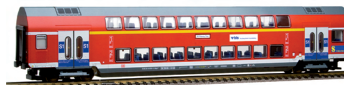
63 101 Doppelstock-Wagen DB, 1./2. Klasse Nr. 50 80 36-81 059-8 von «Hobby Trade»