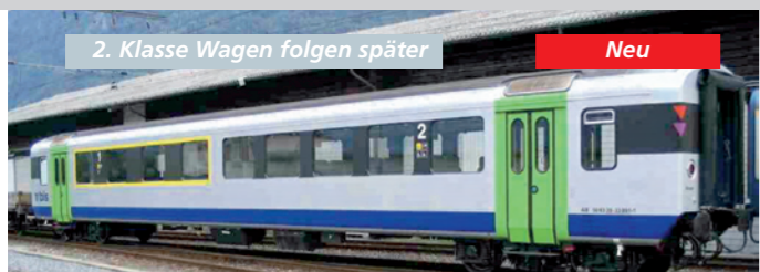
52 032 ~ AC, 52 033 = DC BLS EW 1, AB, 1./2. Klasse, mit Nina-Lackierung