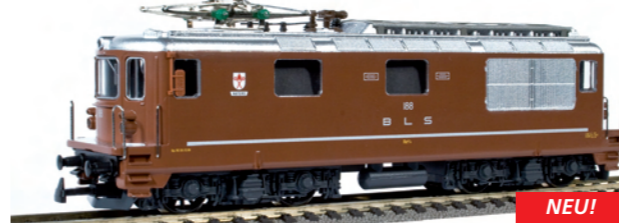
18 017 : BLS Re 4/4 Ville de Neuchatel, Lok Nr. 180 18 018 : BLS Re 4/4 Ausserberg, Lok Nr. 167 Beide mit Scherenpantograph