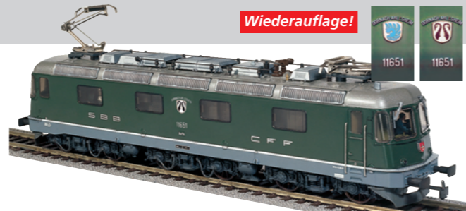
20 500 : SBB Re 6/6 grün, Dornach-Arlesheim, Lok Nr. 11651 Runde Lampen