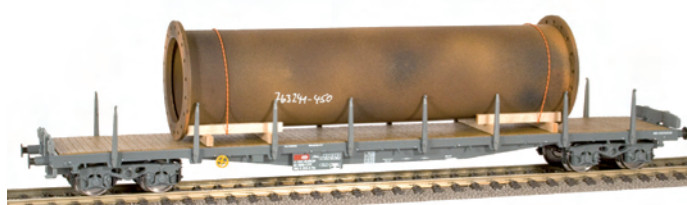
70 058 ~ AC, 70 059 = DC SBB Flachwagen mit Klappungen Typ Rs, mit grosser Röhre