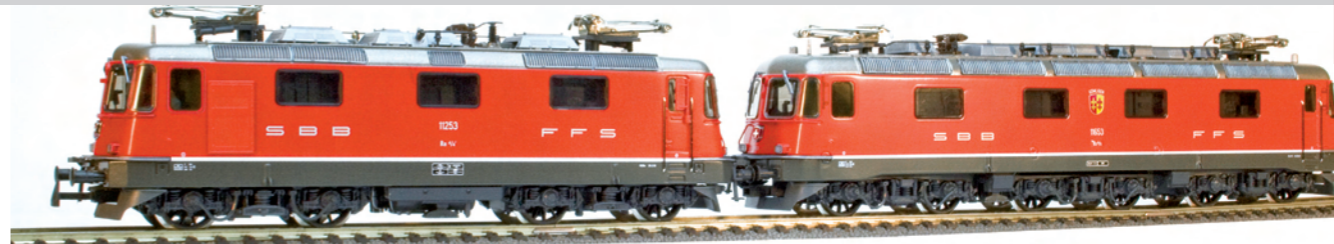
36 021 : SBB Re 10/10, rot Re 4/4 II , rot, Lok Nr. 11253 und Re 6/6, rot, Gümligen, Lok Nr. 11653, beide mit Klima