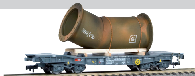
78 030 ~ AC, 78 031 = DC SBB Tiefladewagen Typ Slmmnps, mit abgewinkeltem Rohr (ersetzt die ursprüngliche Artikel Nr. 78 006 und 78 007)