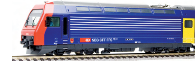
30 016 : SBB Re 450 der S-Bahn Zürich, Winterthur-Veltheim, Lok Nr. 450 096-3, gelbe Gepäcktüre und ZVV Signet