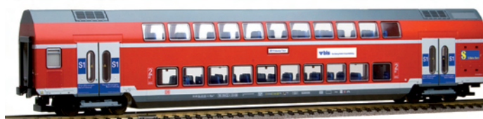
63 104 Doppelstock-Wagen DB, 2. Klasse Nr. 50 80 26-81 121-8 von «Hobby Trade» 63 102 Doppelstock-Wagen DB, 2. Klasse Nr. 50 80 36-81 123-4 von «Hobby Trade»