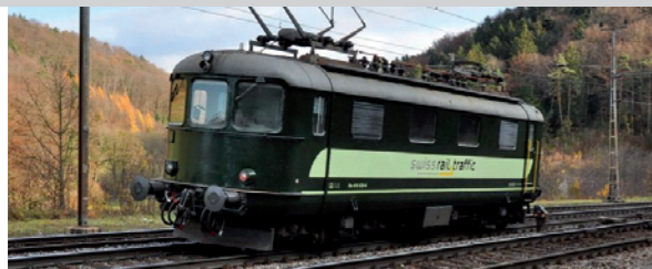
22 018 : Swiss Rail Traffic Re 416 628-6 (Re 4/4 I )