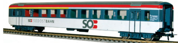
53 008 ~ AC, 53 009 = DC SOB EW 1, AB, 1./2. Klasse, Südostbahn

Solche geliehenen Doppelstöcker hat die BLS auf der S-1-Strecke Bern-Spiez als S-Bahn-Shuttle anno 2008 eingesetzt.