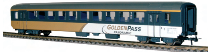
52 020 ~ AC, 52 021 = DC BLS EW 1, A, 1. Klasse, Golden Pass Line