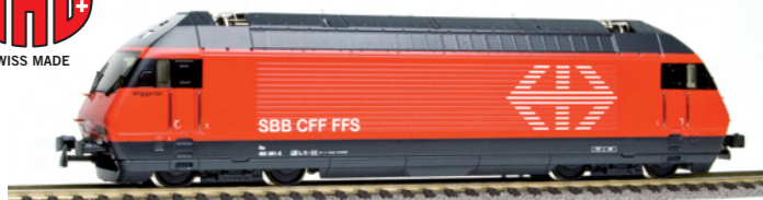
28 011 : SBB Re 460, Pilatus, Lok Nr. 460085-4 28 014 : SBB Re 460, Wiggertal, Lok Nr. 460061-5 28 016 : SBB Re 460, Uetliberg, Lok Nr. 460004-5