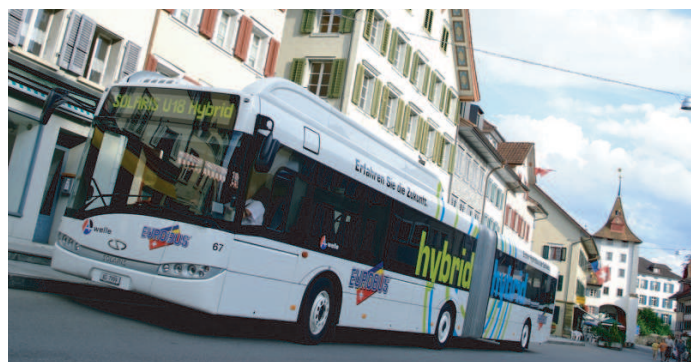
Solaris U18 "Regionalbus Lenzburg" Hybrid 1. Generation