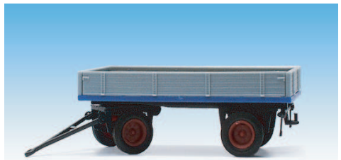
Pritschenwagen, niedrige Bordwände 08700614