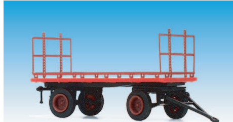
Mehrzweckanhänger mit Metallaufbau 08700619