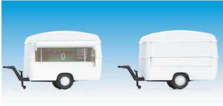
Bausatz, weiss (ein Modell) 08700105