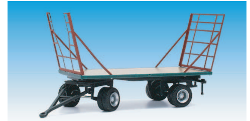
Strohtransporter mit Metallaufbau 08700618

Die drei oben gezeigten Modelle haben ein sehr filigranes, in Deutschland handgeätztes und handlackiertes Messing- bzw. Neusilbergerippe zur Darstellung des jeweiligen Aufbaus.