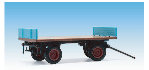
Plattformwagen mit Front- und Heckbordwand 08700616