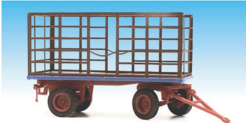
Heuwagen mit Metallaufbau 08700612