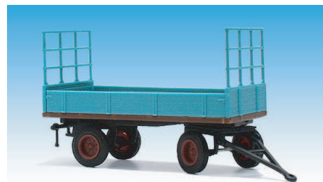
Alter Strohtransporter mit Bordwänden 08700615