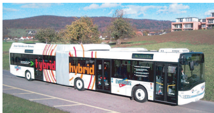
Solaris U18 "Regionalbus Lenzburg" Hybrid 2. Generation