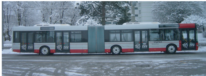
Solaris U18 "Stadtbus Winterthur"