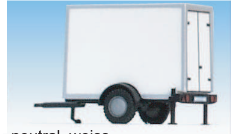
neutral, weiss 08700402