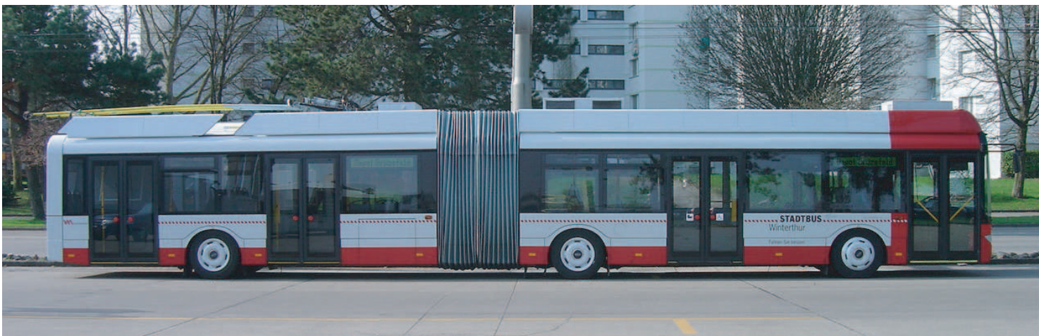
Solaris Trollino 18 "Stadtbus Winterthur"