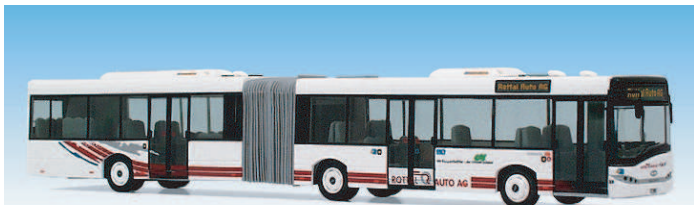
Solaris U18 "Rottal Auto AG"

08701115a Wagen 23, Ziel: Rottal Auto AG