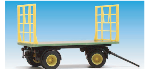
Moderner Strohtransportanhänger 08700608