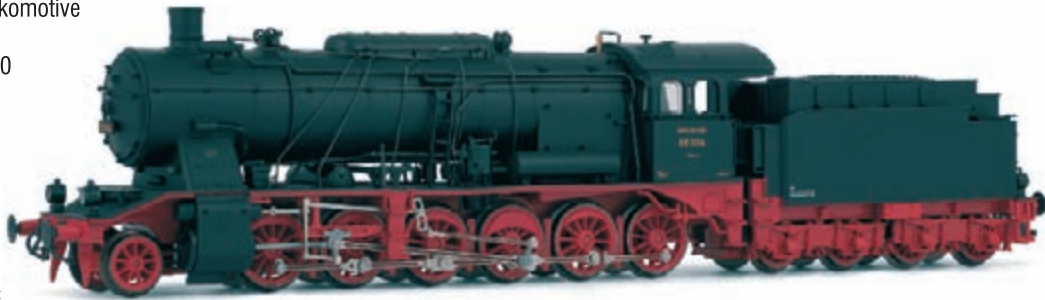
Abbildung zeigt Fotomontag

Schleppender-Dampflokomotive Baureihe 59 der DRG, Betriebsnummer 59 030