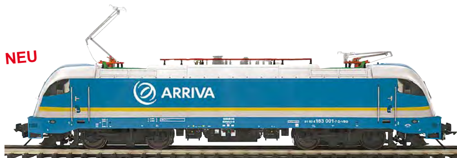
120 05659 2 Elektrolokomotive Baureihe 183 der Vogtlandbahn von Arriva Deutschland GmbH (heute Netinera Deutschland GmbH). Ausführung ES 64 U4-G für den Länderbahn-Express ALEX zwischen München, Hof und Prag (ALEX Nord) bzw. zwischen München, Regensburg und Lindau (ALEX Süd).