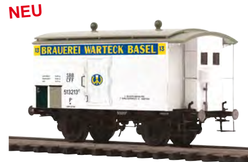
122 90940 0 Privater Kühlwagen P d Ausführung Brauerei Warteck, Basel. Epoche II.