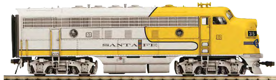
Dieselelektrische Lokomotive F7 der Atchison Topeka & Santa Fe. A-Unit mit Führerstand. Serie 300. Bauart B-B. Epoche IV

180 02115 1 Zweileiter-Gleichstrom Ausführung (DC). Nr. 315 180 02115 5 Mittelleiter-Wechselstrom Ausführung (AC). Nr. 315