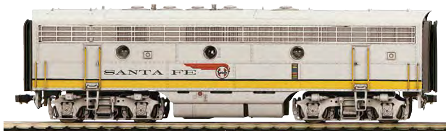
Dieselelektrische Lokomotive F7 der Atchison Topeka & Santa Fe. B-Unit ohne Führerstand. Serie 300. Bauart B-B. Epoche IV

180 02116 1 Zweileiter-Gleichstrom Ausführung (DC). Nr. 345B 180 02116 5 Mittelleiter-Wechselstrom Ausführung (AC). Nr. 345B