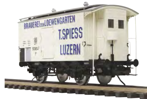
120 90906 0 Privater Bierwagen P d , eingestellt bei den Schweizerischen Bundesbahnen Ausführung Brauerei zum Loewengarten, Luzern. Epoche II und III