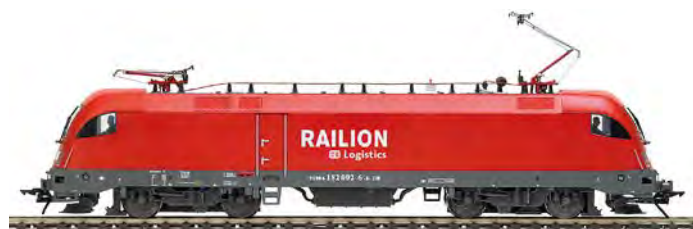
120 05651 2 Elektrolokomotive BR 182 der Railion Deutschland AG / DB AG; Ausführung ES 64 U2 für den Güterverkehr