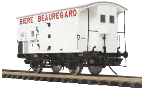
120 90904 0 Privater Bierwagen P d , eingestellt bei den Schweizerischen Bundesbahnen Ausführung Bière Beauregard, Fribourg. Epoche II und III.