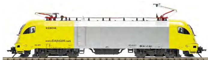
120 05649 2 Elektrolokomotive Serie ES 64 U2 der Siemens Dispolok GmbH; Ausführung für den internationalen Leasing-Einsatz