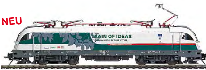
120 05660 2 Elektrolokomotive 183 701 der Siemens Transportation Systems (München); Ausführung ES 64 U4-B als Mietlokomotive für den grenzüberschreitenden Verkehr. Einsatz im »Train of Ideas«, der zwischen Hamburg »European Green Capital 2011« und 17 weiteren Metropolen über nachhaltige Zukunftskonzepte informierte.