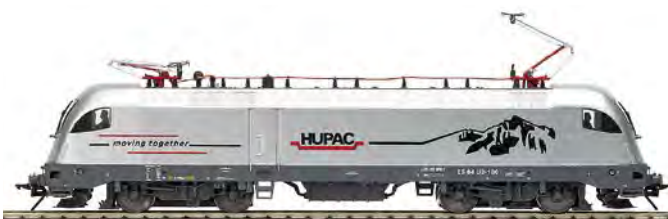
120 05650 2 Elektrolokomotive Serie ES 64 U2 der HUPAC AG (Schweiz); Ausführung für den kombinierten Verkehr und den internationalen Einsatz