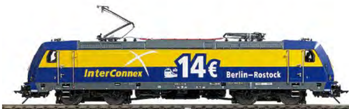
120 05633 2 Elektrolokomotive BR 146.5 der Veolia Verkehr GmbH (Deutschland); Ausführung TRAXX P160 AC2