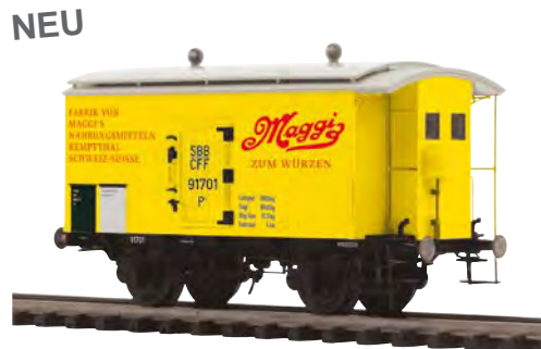
120 90941 0 Privater Kühlwagen P d Ausführung Maggi, Cham. Epoche II