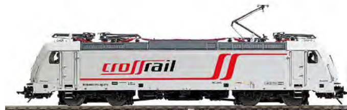
120 05648 2 Elektrolokomotive Serie Re 482 der Crossrail AG (Schweiz); Ausführung TRAXX F140 AC2