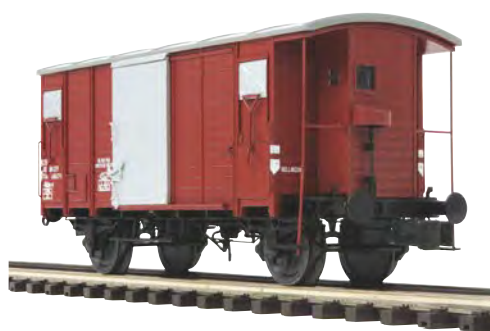
120 90915 0 Gedeckter Güterwagen K 2 der Schweizerischen Bundesbahnen.

Ausführung für Stückgut und Wagenladungen, Epoche II und III, graue Farbgebung.