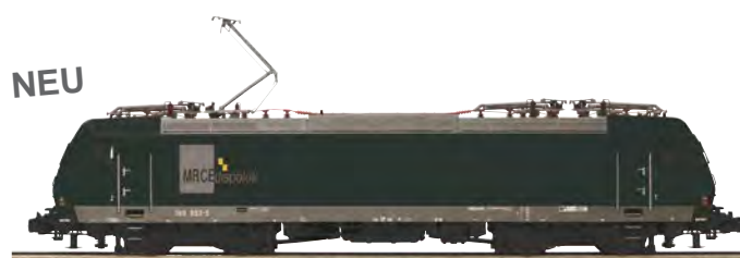
NEU 120 05655 2 Elektrolokomotive BR 185.5 der MRCE Dispolok GmbH (Deutschland); Ausführung TRAXX F140 AC1