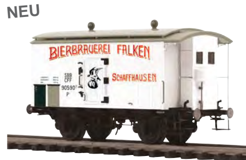
120 90943 0 Privater Bierwagen P d Ausführung Bierbrauerei Falken, Schaffhausen. Epoche II.