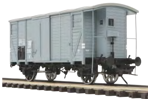
120 90914 0 Gedeckter Güterwagen K 2 der Schweizerischen Bundesbahnen.

Ausführung für Stückgut und Wagenladungen, Epoche II und III, graue Farbgebung.