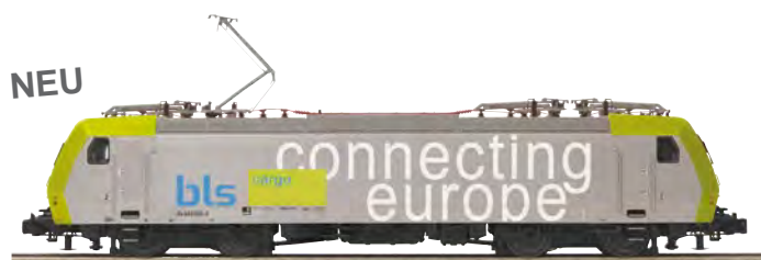
NEU 120 05654 2 Elektrolokomotive Re 485 der BLS Cargo (Schweiz) Ausführung TRAXX F140 AC1