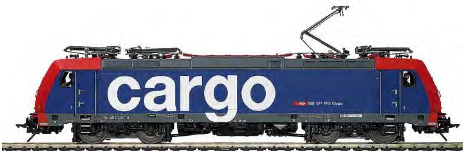
120 05632 2 Elektrolokomotive Serie Re 482 der SBB Cargo AG (Schweiz) Ausführung TRAXX F140 AC2