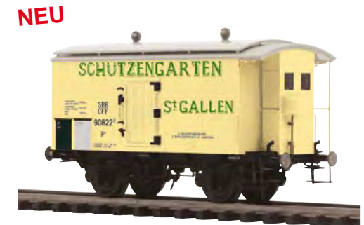
122 90942 0 Privater Bierwagen P d Ausführung Bierbrauerei Schützengarten, St. Gallen. Epoche II.