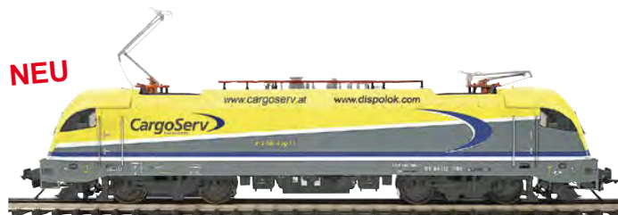
120 05658 2 Elektrolokomotive Reihe 1216.9 der Logistik Service GmbH (Linz / Österreich); Ausführung ES 64 U4-B9 für den grenzüberschreitenden Verkehr der Cargo Service GmbH.