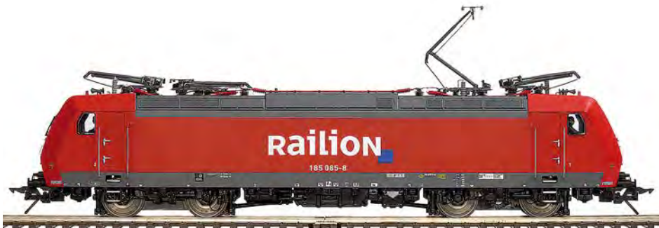
120 05634 2 Elektrolokomotive BR 185.0 der Railion Deutschland AG (DB AG) Ausführung TRAXX F140 AC1