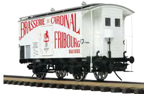
120 90905 0 Privater Bierwagen P c , eingestellt bei den Schweizerischen Bundesbahnen Ausführung Brasserie du Cardinal, Fribourg. Epoche I, II, III und Museum.