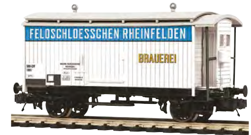
120 90907 0 Privater Bierwagen P , eingestellt bei den Schweizerischen Bundesbahnen Ausführung Feldschloesschen Rheinfelden. Epoche I, II, III und Museum.