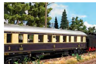
120 60018 0 Fernschnellzug »Rheingold« Set aus 5 Salonwagen der Deutschen Reichsbahn. Epoche II. Farbgebung: violett / beige