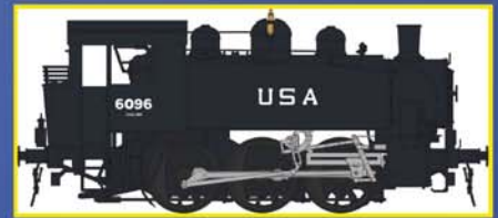
MB-011 - 030 TU 6096 USA "CHÂLONS", Analog MB-011S - 030 TU 6096 USA "CHÂLONS", DCC Sound