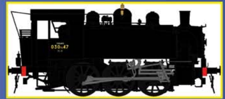
MB-007 - 030 TU 47 OUEST "THOUARS", Analog MB-007S - 030 TU 47 OUEST "THOUARS", DCC Sound