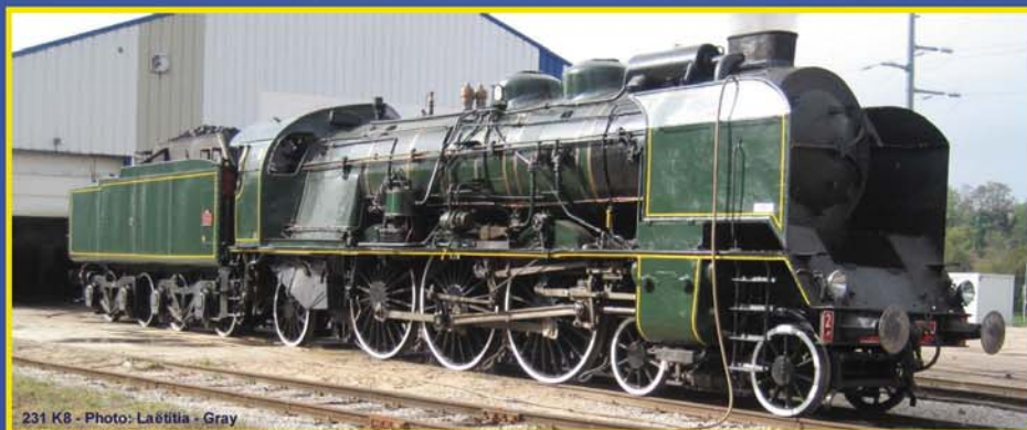
231 K8

Steam machine 231 ex-PLM tender 38A North Serial 2 - Novembre 2013