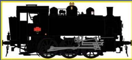
MB-005 - 030 TU 3 EST "SARREGUEMINES", Analog MB-005S - 030 TU 3 EST "SARREGUEMINES", DCC Sound