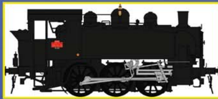
MB-009 - 030 TU 72 SUD-EST "BEZIERS", Analog MB-009S - 030 TU 72 SUD-EST "BEZIERS", DCC Sound