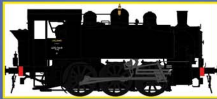
MB-006 - 030 TU 18 NORD "LILLE-DELIVRANCE", Analog MB-006S - 030 TU 18 NORD "LILLE-DELIVRANCE", DCC Sound