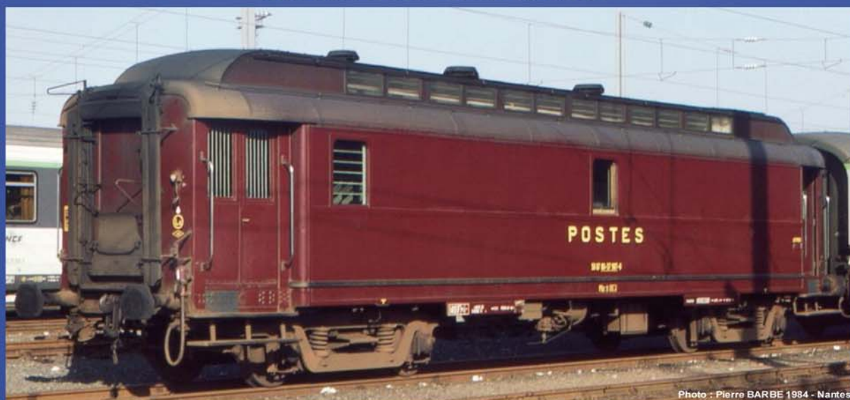
1984 - Nantes

Remerciements à La Poste pour nous avoir autorisé à reproduire sa marque sur les produits.