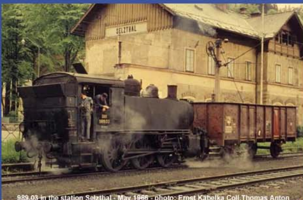
989.03 in the station Selzthal - May 1966