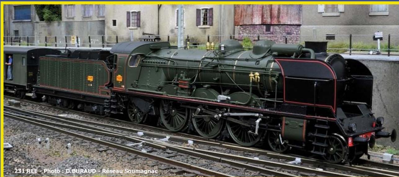
231 REE - Photo : D.BURAUD - Réseau Soumagnac