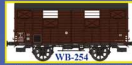
WB-254 Couvert OCEM19 SNCF Ep.III B Closed wagon OCEM 19 - SNCF Era III B