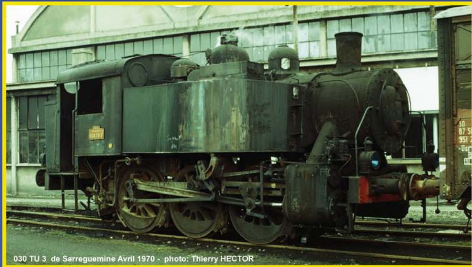
030 TU 3 de Sarreguemine Avril 1970