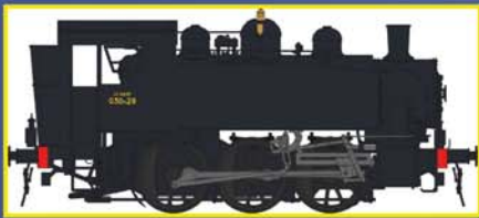
MB-008 - 030 TU 28 OUEST "LE HAVRE", Analog MB-008S - 030 TU 28 OUEST "LE HAVRE", DCC Sound