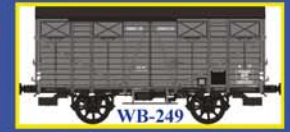
WB-249 Couvert OCEM19 Ep.II - MIDI Closed wagon OCEM 19 Era II - MIDI