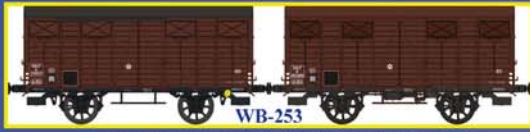
WB-253 SET de 2 Couverts OCEM19 SNCF Ep.III B Set of 2 closed wagons OCEM 19 - SNCF Era III B