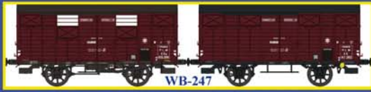
WB-247 SET de 2 Couverts OCEM19 Ep.II - PLM - Frein levier et rochet Set of 2 closed wagons OCEM 19 Era II - PLM

Wagons Couvert OCEM 19 Série 1 - Été 2013 Closed Wagons OCEM 19 Serial 1 - Summer 2013