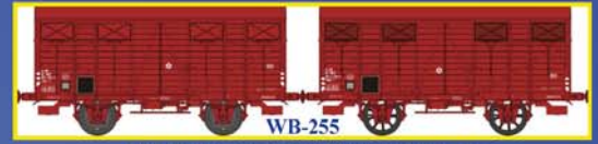
WB-255 SET de 2 Couverts OCEM19 SNCF Ep.IV Set of 2 closed wagons OCEM 19 - SNCF Era IV