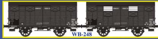
WB-248 SET de 2 Couverts OCEM19 Ep.II - AL Set of 2 closed wagons OCEM 19 Era II - AL