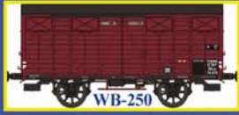
WB-250 Couvert OCEM19 Ep.II - ETAT Closed wagon OCEM 19 Era II - ETAT