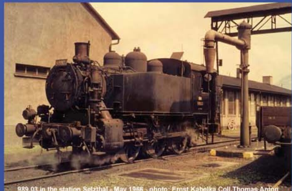
989.03 in the station Selzthal - May 1966