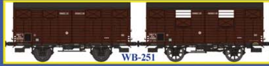
WB-251 SET de 2 Couverts OCEM19 SNCF Ep.III A Set of 2 closed wagons OCEM 19 - SNCF Era III A