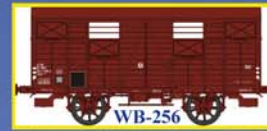
WB-256 Couvert OCEM19 SNCF Ep.IV Closed wagon OCEM 19 - SNCF Era IV