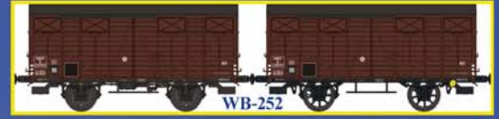
WB-252 SET de 2 Couverts OCEM19 SNCF Ep.III B Set of 2 closed wagons OCEM 19 - SNCF Era III B