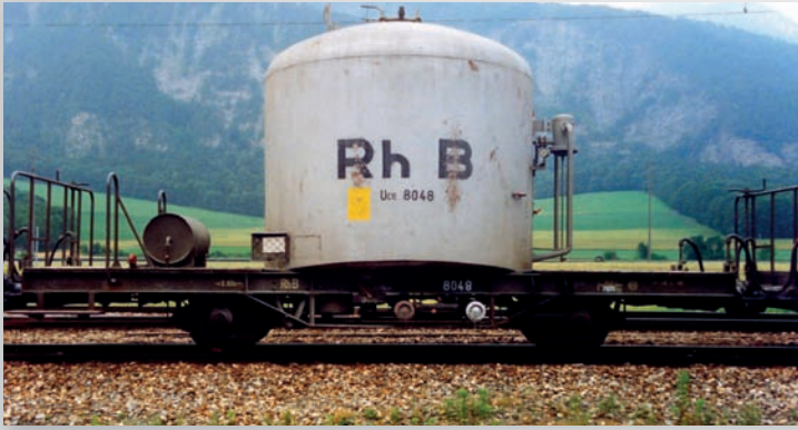
9452 118 Uce 8048 silber