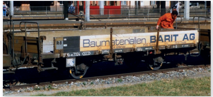
9463 124 Kk-w 7324 Niederbordwagen „BARIT AG“