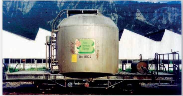
9452 114 Uce 8004 silber mit grünem B