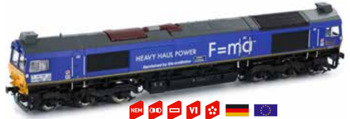
H70002 Class 77 HHPI Ep. VI UVP 199,90