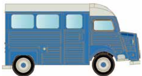
LC4156 Citroën Typ HY, Bus blau UVP 12,95