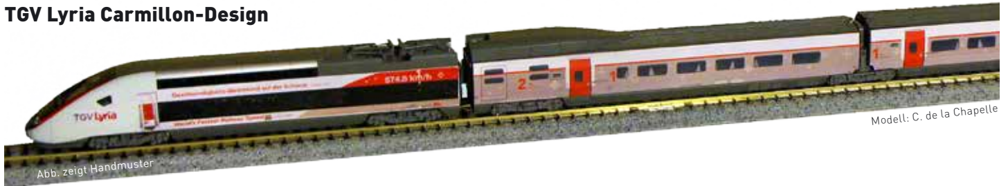
Modell: C. de la Chapelle