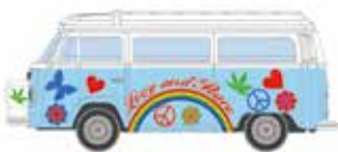
LC3870 VW Bus T2 Westfalia Camper „Hippie Bus“ UVP 10,95