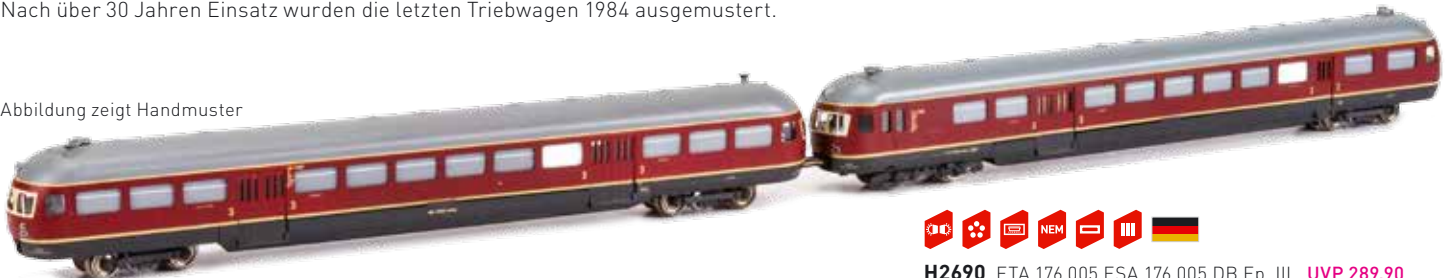
Abbildung zeigt Handmuster

1952 stellte die Deutsche Bahn die ersten Akkutriebwagen der Nachkriegsbauart vor. Diese sollten als ETA 176 bezeichnet sowohl im Nahverkehr, als auch als komplette Eilzüge einsetzbar sein. Nach über 30 Jahren Einsatz wurden die letzten Triebwagen 1984 ausgemustert.