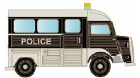
* LC4159 Citroën Typ HY, Police UVP 13,95