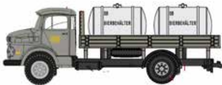
LC3460 MB L 322 „von Haus zu Haus“ mit DB Bier tanks UVP 14,95