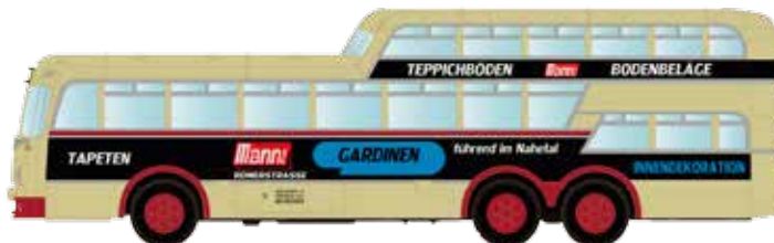
LC3913 Büssing Aero 1 1/2 Deck Omnibus Bad Kreuznach „Mann KG“ UVP 24,95