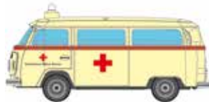
LC3872 VW Bus T2 Kastenwagen „DRK“ UVP 10,95