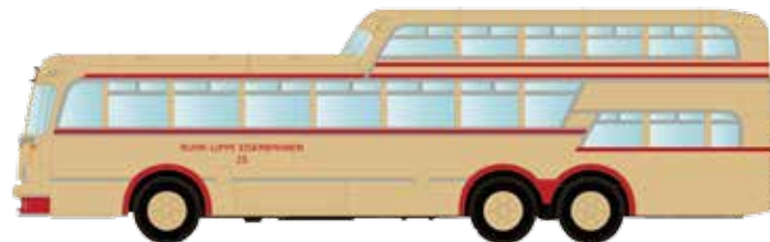
LC3911 Büssing Aero 1 1/2 Deck Omnibus „Ruhr-Lippe-Eisenbahn“ UVP 24,95