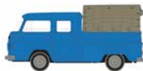
LC3875 VW Bus T2 Doppelkabine, Pritsche/Plane UVP 9,95