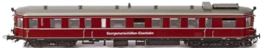
Abb. zeigt H0-Modell

H2684 VT 2 Georgsmarienhütte Ep. IV, exklusiv Idee+Spiel UVP 159,90