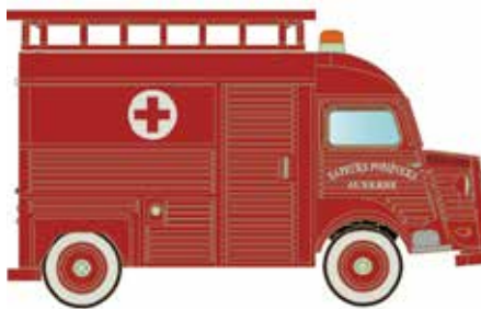
* LC4157 Citroën Typ HY, Feuerwehr Sapeurs Pompiers UVP 13,95