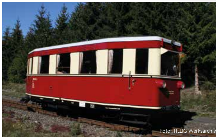
Abbildung zeigt HSB-Museumswagen

FORMNEUHEIT: Triebwagen VT 133 522 der DR NEW: Rail car 133 522 of the DR