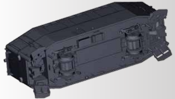
Arbeitsstand November 2017

FORMNEUHEIT: Triebwagen T1 der MEG (Mittelbadische Eisenbahn-Gesellschaft) NEW: Rail car T1 of the MEG (Mittelbadische Eisenbahn-Gesellschaft)