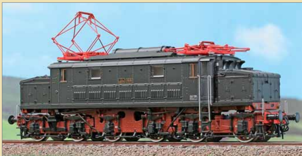
Locomotiva elettrica E626.101 in livrea nera, con emblema storico da applicare, Deposito di Foggia. Electric locomotive E626.101 in black livery, with historical emblem to apply, Foggia Depot. Elektrolokomotive E626.101 in schwarzer Lackierung, mit historischem Emblem, Bw Foggia.